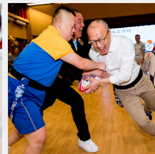
▲ 首創共融檯球，連結主流特殊學生同心同樂。