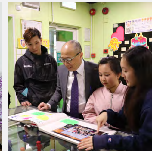
▲ 到訪青年中心，為年輕一代加油。