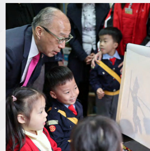
▲ 與學生一起欣賞皮影戲，同歡樂同學習。