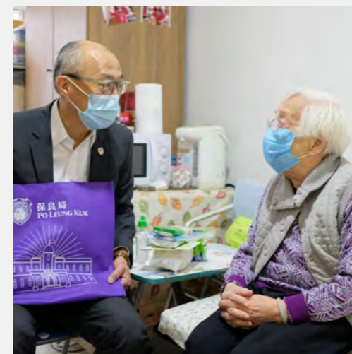
▲ 疫情之下，身體力行製備派送防疫包，支援弱勢社群。