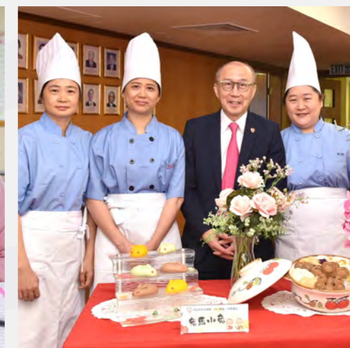
▲ 「回味」流心軟餐，以創新為吞嚥困難患者調製細心滋味。