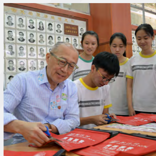
▲ 賣旗日圓滿完成，感激大眾市民慷慨支持。