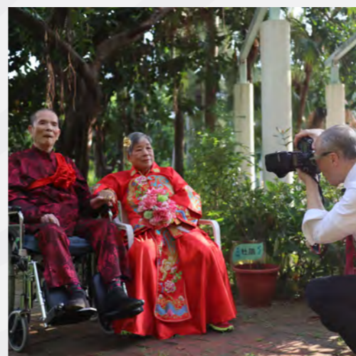
▲ 擔任攝影師，為老夫婦補拍婚照，見證真愛。