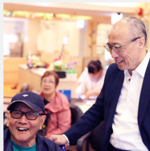
▲ 探訪安老單位，與長者交流笑談。