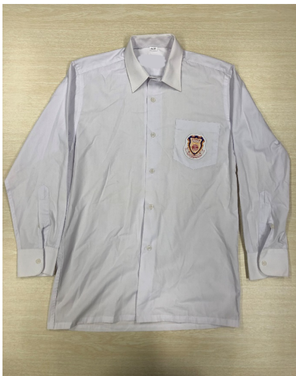
8. 白色風壓領長袖恤衫(連校章)