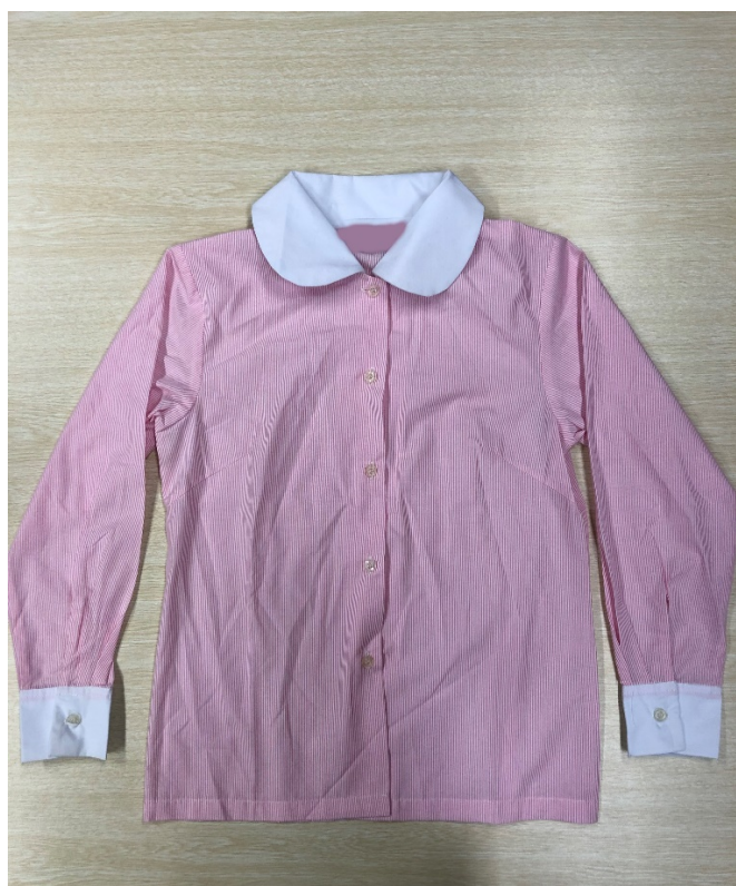
10. 粉紅條子圓領長袖恤衫